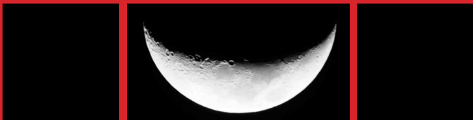
Phase de la Lune.

Levez les yeux et mettez la tête dans les étoiles grâce à ce planétarium gonflable. Son planétaire de type "Cosmodyssée 2" permet de visualiser le Soleil, la Lune, les planètes du Système solaire, la Voie lactée et jusqu'à 800 étoiles de toutes les latitudes !